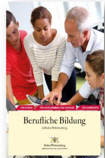
Broschüre „Berufliche Bildung in Baden-Württemberg“