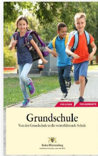
Broschüre „Grundschule – Von der Grundschule in die weiterführende Schule“