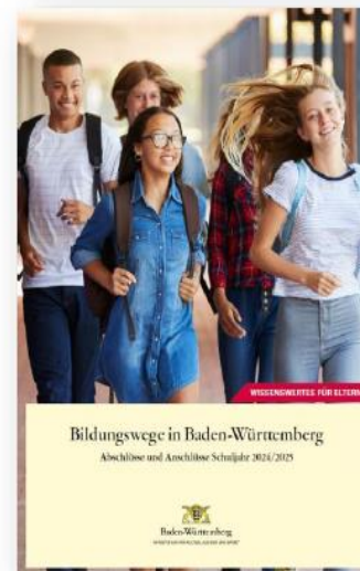
Broschüre „Bildungswege in Baden-Württemberg“